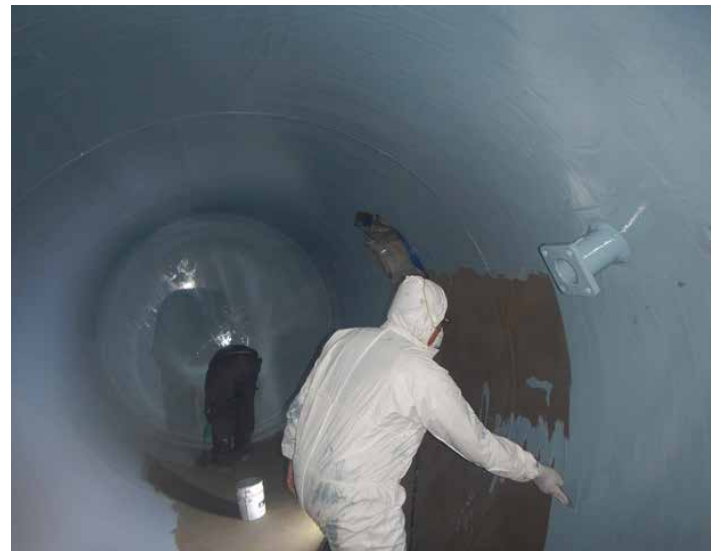
已手工敷涂贝尔佐纳 (Belzona) 1391T